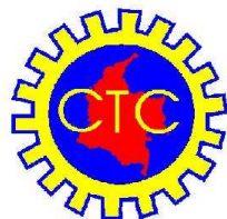
Confederación de Trabajadores de Colombia