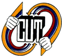
Central Unitaria de Trabajadores